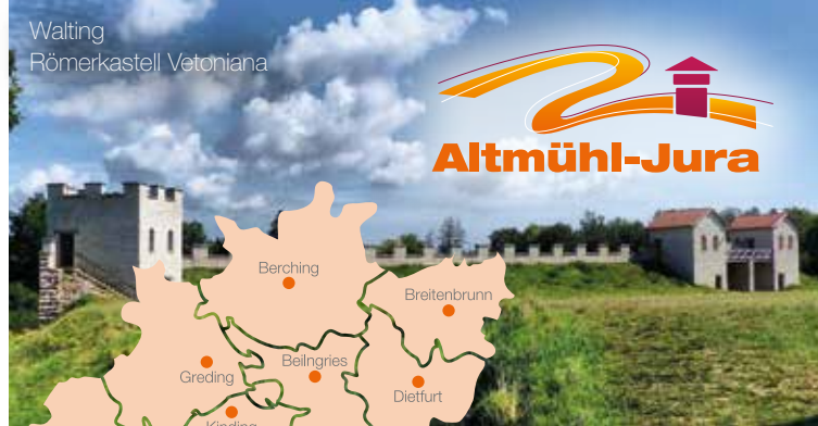
Walting Römerkastell Vetoniana